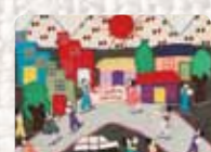
Paz - Justicia - Libertad Chile. Anónima. Finales de los 70 Colección Conflict Textiles Procedencia: Alba Sanfeliu, España