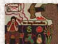
Cesantía Chile. Hombre preso anónimo. c 1980 Foto: Martin Melaugh Colección Conflict Textiles Procedencia: Lala & Austin Winkley, Inglaterra