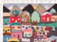
Queremos Democracia Chile. Vicaría de la Solidaridad. 1988 Colección Conflict Textiles Procedencia : Seán Carroll, EEUU