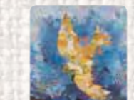
Peace Dove Irlanda del Norte. Irene MacWilliam. 1987 Foto: Irene MacWilliam Colección Conflict Textiles