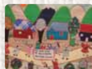
No a las alzas / No a la dictadura / Basta de hambre Chile. Anónima. c 1980 Colección Conflict Textiles Donación: Fátima Miralles, España