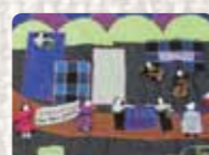
Paro de los estudiantes chilenos Chile. Pamela Luque. 2012 Foto: Rory Mc Carron Colección Conflict Textiles