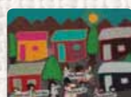
Movimiento contra la tortura Chile. Anónima. 1989 Colección Conflict Textiles Procedencia: Museo Oshima Hakko, Japón