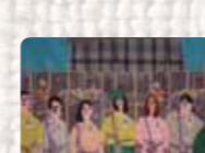
Encadenamiento Chile. Anónima. Finales de los 80 Foto: Martin Melaugh Colección Conflict Textiles Procedencia Colección arpilleras Kinderhilfe Chile-Bonn, Alemania