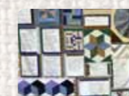
Hilvanando la búsqueda / Stitching the search Chile. Nicole Drouilly. 2014 Foto: Nicole Drouilly Colección Conflict Textiles