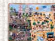
Posar fil a l'agulla Catalunya/España. Fundació Ateneu Sant Roc. 2013-2015