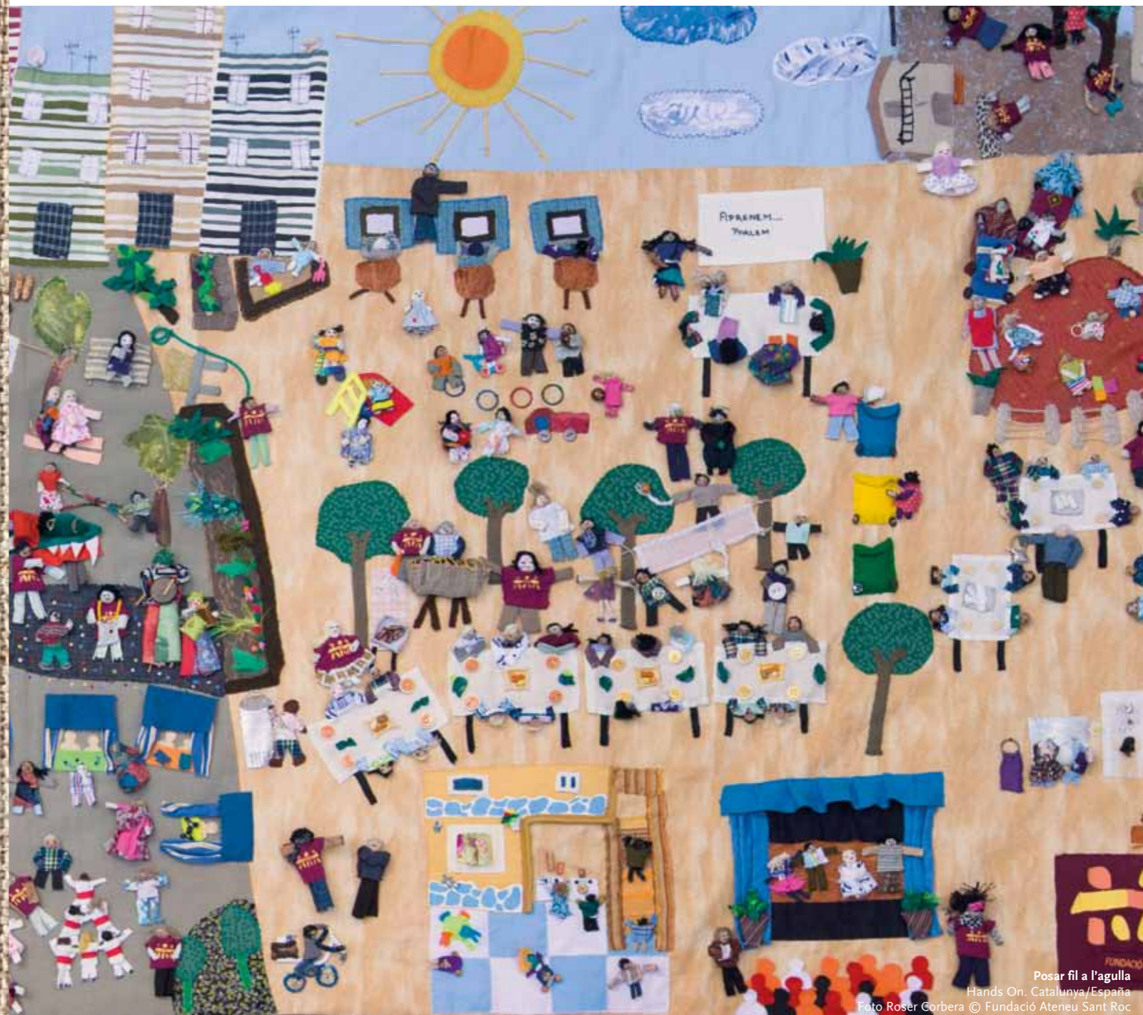
Posar fil a l'agulla Hands On. Catalunya/España

TISSER LA PAIX Conflit, Arpilleras, Mémoire