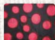
Disappeared Irlanda del Norte. Irene MacWilliam. 2013 Foto: Irene MacWilliam Colección Conflict Textiles