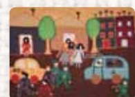
No al plebiscito, no podemos ni opinar Chile. Anónima. 1980 Foto: Martin Melaugh Colección Conflict Textiles