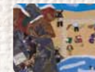
Exilio de los republicanos cruzando los Pirineos Catalunya/España. Fundació Ateneu Sant Roc. 2012