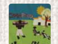
Cimarrón Colombia. Mujeres tejiendo sueños y sabores de paz. 2010 Foto: Martin Melaugh Colección Conflict Textiles