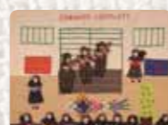
Violar es un crimen Perú. Taller Mujeres Creativas. 1985. Replica de FCH, Taller Mujeres Creativas Perú. 2008