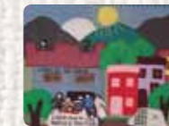
Libertad a los presos políticos Chile. Anónima, 1985 Colección Conflict Textiles Procedencia: Colección de arpilleras Kinderhilfe Chile/Bonn, Alemania