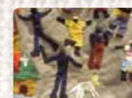
The day we will never forget Zimbaue. Killarney Girls. Trabajo colectivo facilitado por Shari Eppel. 2012. Solidarity Peace Trust Zimbaue Foto: Shari Eppel Colección Conflict Textiles Procedencia: Killarney girls