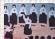
La Cueca Sola Chile. Anónima. 1989 Colección Conflict Textiles Procedencia colección Oshima Hakko Museum, Japón