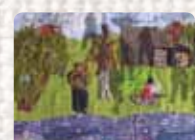
Soldiers back from the wars Inglaterra (Trilogía). Linda Adams. 2010 Colección Conflict Textiles