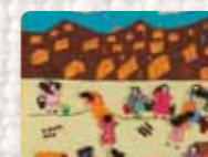
Toma de terrenos en los barrios de Lima Perú. Taller Mujeres Creativas. 1986 Replica, Taller Mujeres Creativas. 2008 Foto: Colin Peck Colección Conflict Textiles