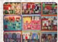
Penurias en nuestra población Chile. Fundación de Ayuda Social de las Iglesias Cristianas (FASIC). 1979 Foto: Tony Boyle Colección Conflict Textiles Procedencia: Consejo Mundial de Iglesias