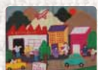
Hay Golpe de Estado Chile. Anónima. 1989 Foto: Martin Melaugh Colección Conflict Textiles Procedencia: Colección Professor Masaaki Takahashi, Japón