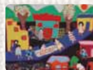
Somos mujeres cesantes Chile. Anónima. c 1980 Colección Conflict Textiles Procedencia: Theresa Wolfwood, Victoria, Canadá