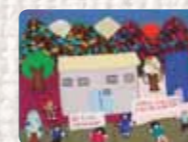
No a la impunidad Chile. Anónima. Años 80 Colección Conflict Textiles. Donación: Lala & Austin Winkley, Inglaterra